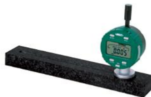
直线度/平面度测量规